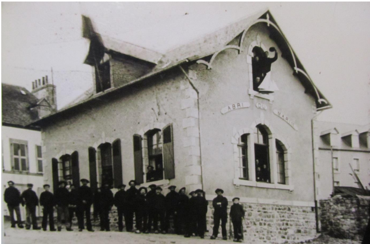
Les marins de Roscoff fréquentent en grand nombre l'Abri du marin

L'Echo du Finistère Journal régionaliste indépendant paraissant le samedi du 1 er janvier 1910