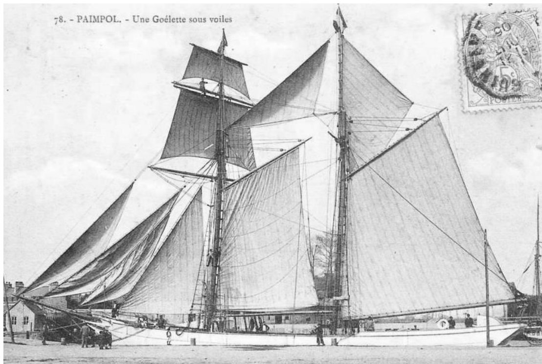
Une grande goélette, de construction locale tardive, certainement construite chez Bonne Lesueur remarquable avec hunier à rouleau et cacatois

Je ne doute pas que l'arrivée de grand yacht au port de Paimpol a fortement intéressé les constructeurs du port, ils les ont transformées pour la pêche, le salon de yacht est devenu la cale pour les morues. L'étude des formes et des méthodes de construction ont certainement eu une influence sur leurs constructions postérieures.