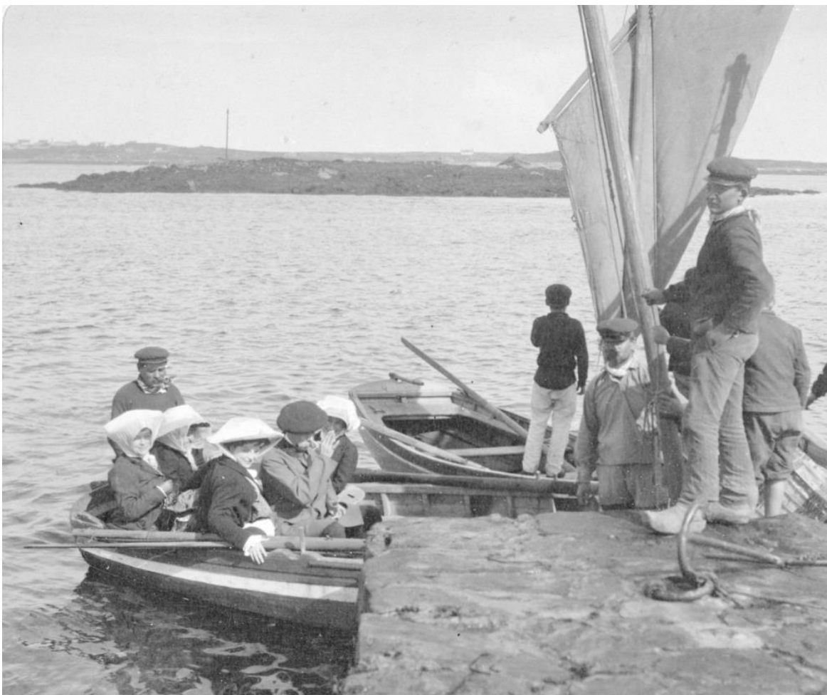
Cette famille est maintenant dans un canot de passage de l'île de Batz

Ces photos d'un auteur inconnu sont d'un album de ma collection acheté sur un site de vente en ligne.