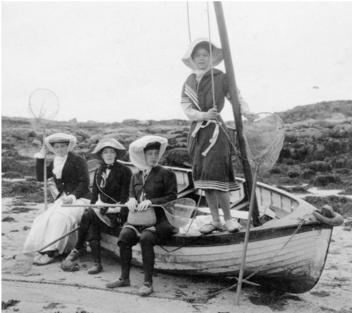
Les quatre jeunes femmes posent dans un canot à clin construit par le chantier Kerenfors