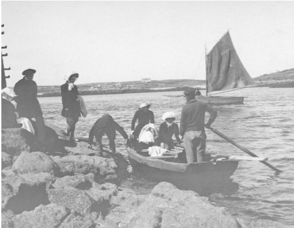
Embarquement au nord de la tourelle, le courant de flot est bien établi

Octobre 2020 Pierre-Yves Decosse http://www.histoiremaritimebretagnenord.fr/