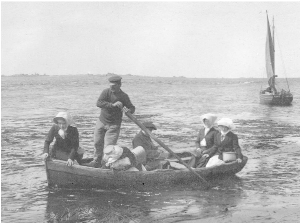
C'est le patron qui fait le service du canot

Octobre 2020 Pierre-Yves Decosse http://www.histoiremaritimebretagnenord.fr/