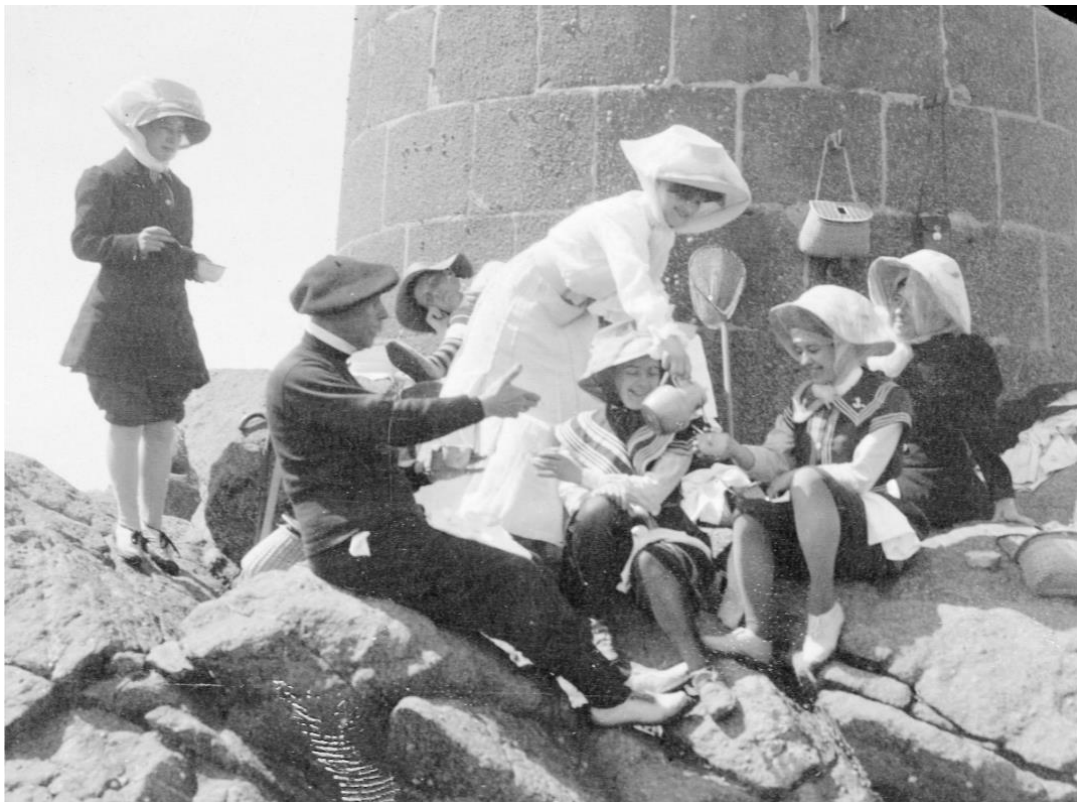
La collation arrosée d'un pichet de cidre, au pied de la tourelle

Octobre 2020 Pierre-Yves Decosse http://www.histoiremaritimebretagenord.fr/