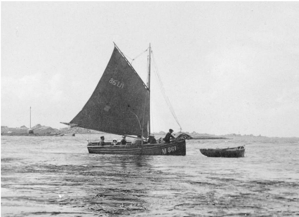
Le matelot à l'avant vient d'amener le foc, à l'arrière-plan la balise d'Ar Poloss Treas