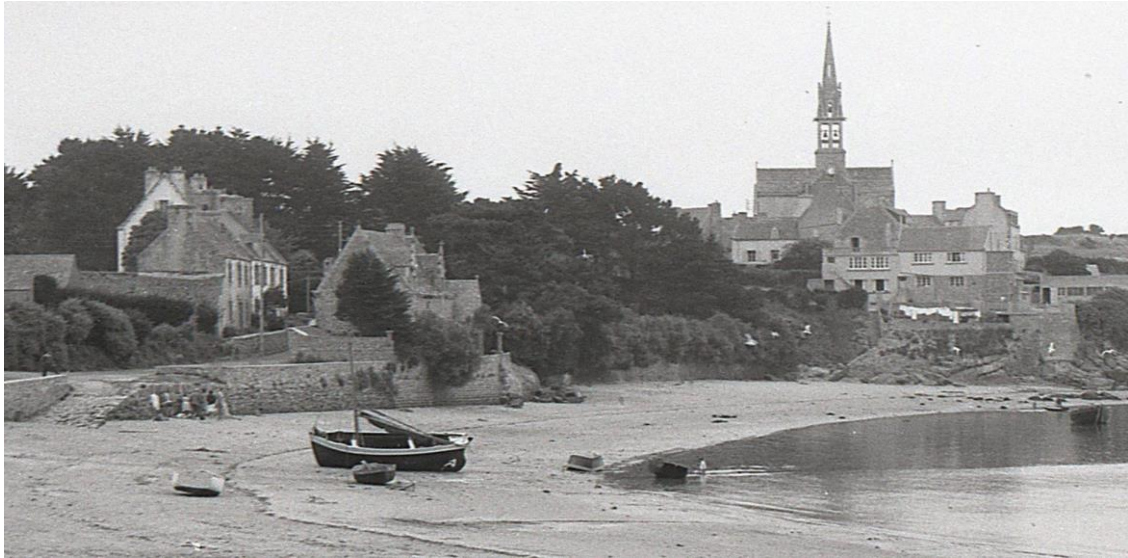
Quartier de Kernoch le long du port, la maison des Créach était la maison à la façade blanche, cette maison avait été, au préalable, le premier bureau de poste de l'île

Trop peu de mes articles sont consacrés aux femmes et mères de marin, pourtant leur rôle a toujours été essentiel dans la vie du littoral. Leur vie était dure, on ne peut s'imaginer l'inquiétude de ses femmes lorsque leurs hommes étaient en mer par mauvais temps. Souvent d'une force de caractère remarquable elles savaient rester positives face à l'adversité.