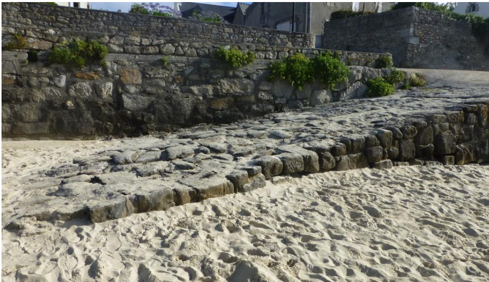
Une modeste descente à la grève fait partie du patrimoine maritime local, à l'île de Batz cette descente à la grève de Pors Kernoc 'h date au moins du XVIIIème siècle

Cet inventaire est très ouvert et concerne tous les ouvrages, mobiliers ou immobiliers, qui n'existeraient pas sans la présence de la mer et peut porter sur tout éléments de plus de 30 ans .