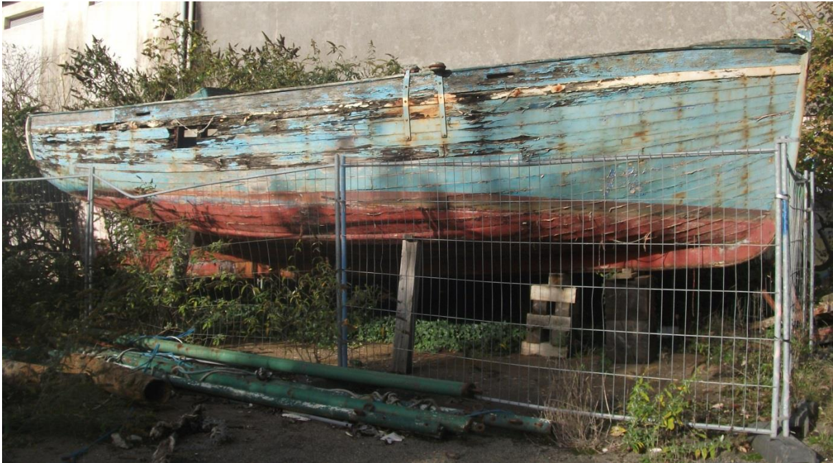
Le Pirate ancien bateau de Louis le Saout de l'île de Batz à l'état d'épave dans les réserves du Port Musée de Douarnenez en novembre 2013