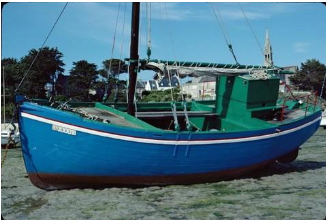
Le Pirate bateau de passage et de transport de l'île de Batz de 11.48tx construit en 1956 à Carantec photographié vers 1980, amoureuxment entretenu par son propriétaire

Septembre 2015 Pierre-Yves Decosse http://www.histoiremaritimebretagnenord.fr/