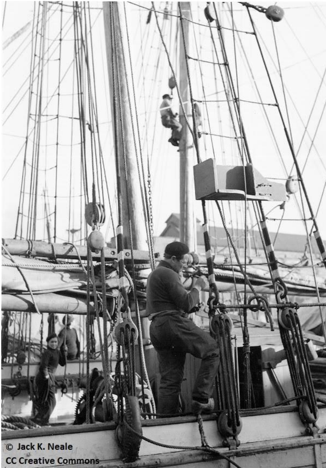
Un matelot de la goélette la Bretonne repeint en blanc les amarrages en fil de fer galvanisé des haubans, au second plan à bord d'une autre goélette un matelot assis sur une chaise de calfat gratte le mât (Photo Jack K. Neale)

Mars 2016 Pierre-Yves Decosse http://www.histoiremaritimebretagnenord.fr/