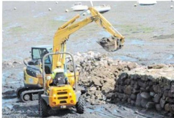
Les travaux de démolition de la vieille cale de Pempoul, réalisés par l'entreprise Marc, ont débuté lundi.

Les travaux envisagés concernaient le quai sud, ancien quai de sable, construit en 1867, et la cale