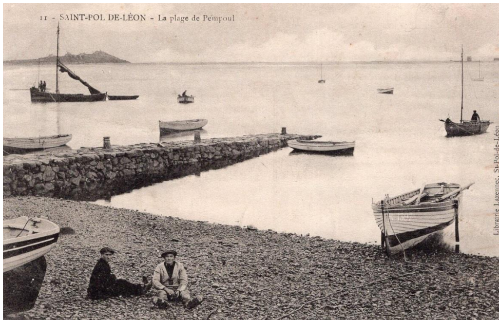
La cale dans son usage ancien vers 1910, son état actuel en est proche. le sloup a clin sur la droite M 1397 est magnifique

Je m'indigne vraiment face à cette destruction et je vous invite à passer voir ce massacre du patrimoine maritime local pendant les journées du patrimoine le 16 et 17 septembre 2017.