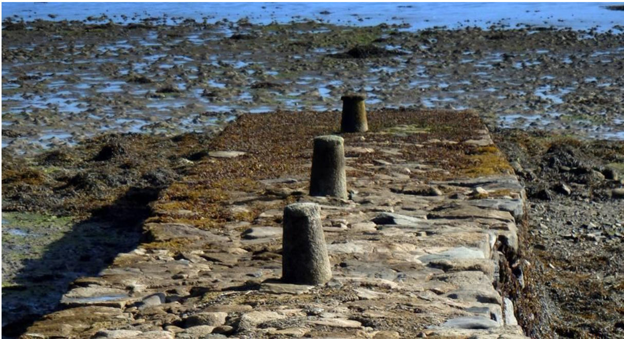
La cale de Pempoul avant sa démolition