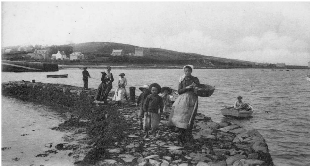
La jetée courbe du même ensemble portuaire à Pempoul, aujourd'hui à l'état de vestiges. Les cales étaient des lieux de vie et de lien social où se rencontraient les hommes de mer et ceux de la terre, les femmes, les enfants

Je m'indigne vraiment face à cette destruction et je vous invite à passer voir ce massacre du patrimoine maritime local pendant les journées du patrimoine le 16 et 17 septembre 2017.