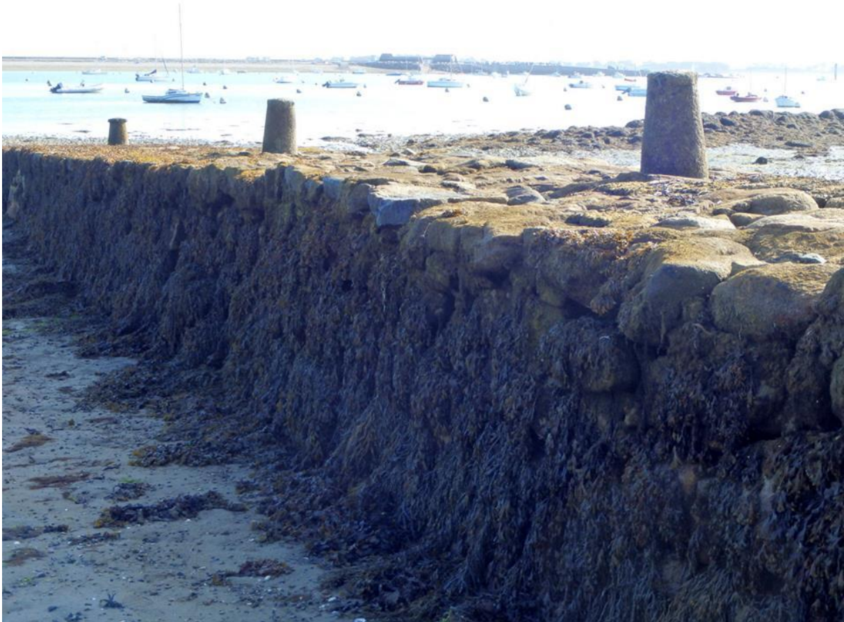
Appareil en pierres sèches de la cale et ses trois bittes d'amarrage

Construit avec des petits moyens en pierres sèches de granit local à peine équarries, de par sa forme irrégulière et la mise en œuvre des matériaux elle est typique des constructions très locale construite sans plan elle est différente des ouvrages plus important en pierres de taille et aux lignes régulières. Cette cale est équipée de trois bittes d'amarrage en pierre.