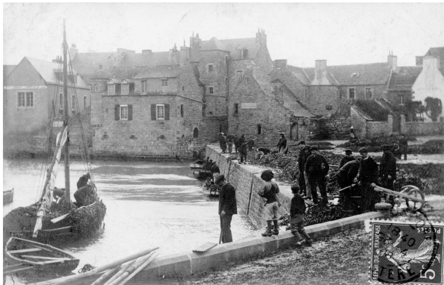
Déchargement de goémon de rive au port de Roscoff, la gabare sur la gauche est certainement une gabare de l'île, Roscoff n'armant pas ce type de bateau

http://www.skolvreizh.com/index.php?page=shop.product_details&category_id=24&flypage=flypage_images.tpl&product_id=302