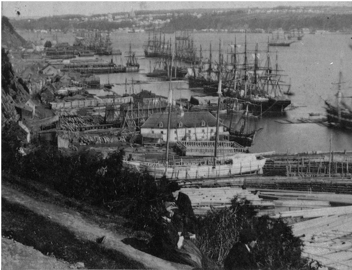
Le port de Québec et ses chantiers navals en 1865, le Brunelle est peut être un des navires au mouillage sur le fleuve Saint Laurent (Coll archives du Canada)