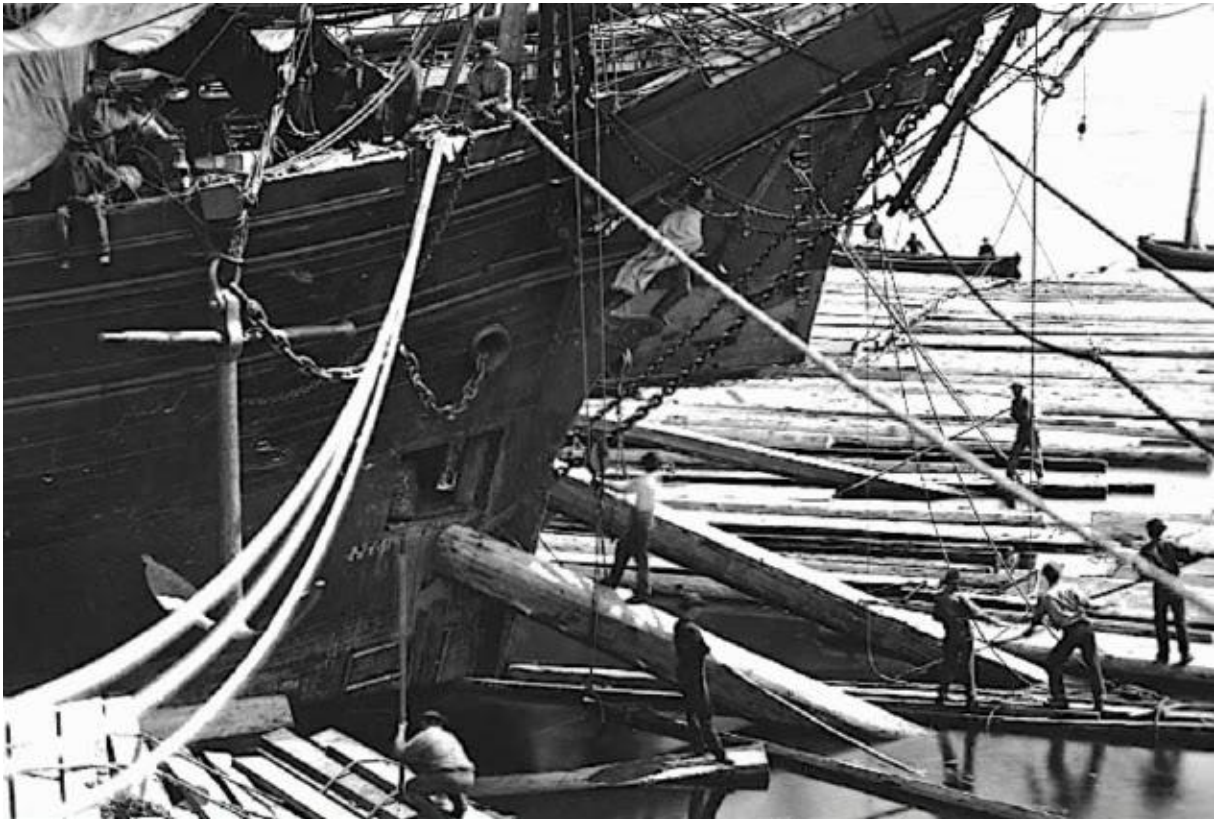
Navires chargeant du bois à Québec en 1872, le chargement de bois du Brunelle l'a maintenu à flot pendant sa dérive

Dans la nuit du 22 au 23 décembre 1869 le navire s'échoue sur la côte rocheuse de Ploumanac'h ou de Trégastel, l'endroit exact de l'épave n'est pas identifié, Le navire est perdu mais le chargement de bois est partiellement récupéré.