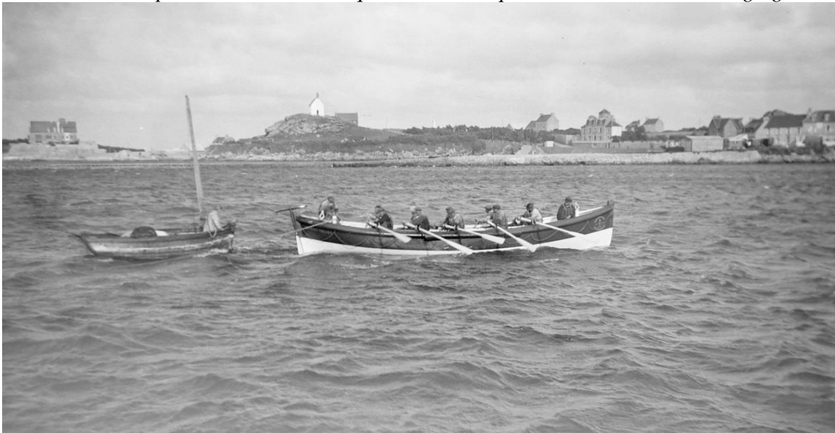
Le 17 juillet 1936, 18h45 le canot de sauvetage Georges Bréant de la station de Pontusval entre dans le port de Roscoff avec à sa remorque un canot à misaine et un petit sloup celui-ci n'est pas dans le champ de la photo graphique mais on aperçoit sa remorque

Mars 2016 Pierre-Yves Decosse http://www.histoiremaritimebretagenord.fr/