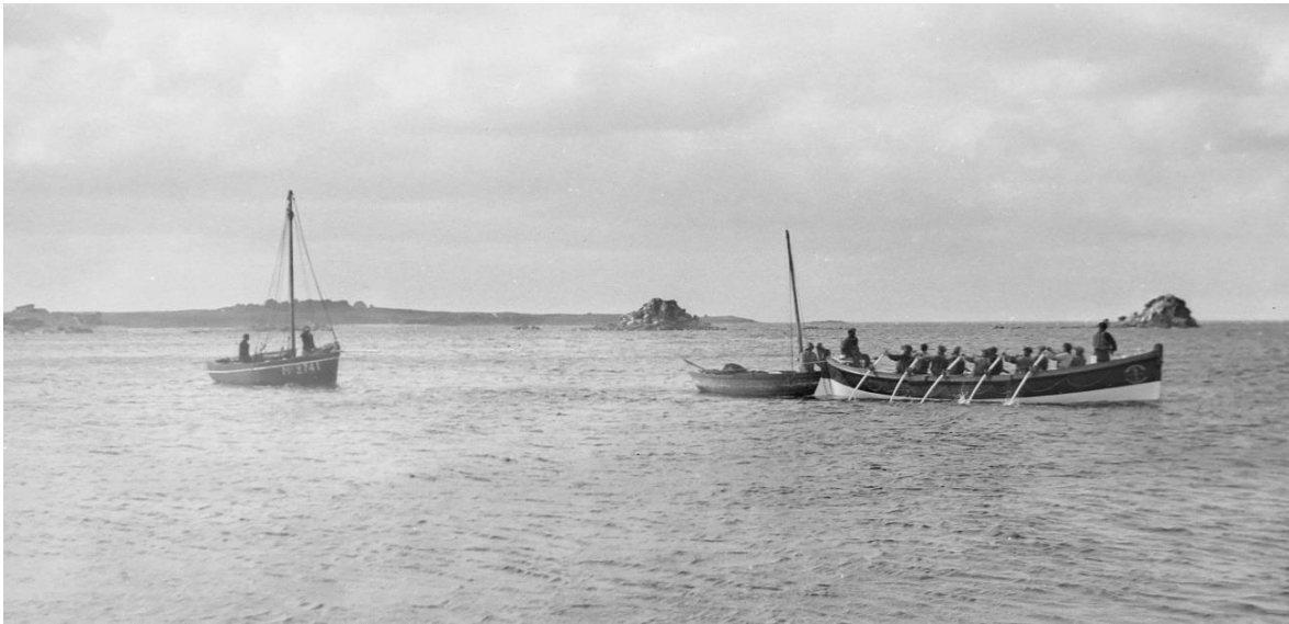
Le canot de sauvetage de Pontusval Georges Bréant passant par l'ancien chenal le canot Renard et le sloup Corentine en remorque, au second plan l'île Verte et les Bourguignons