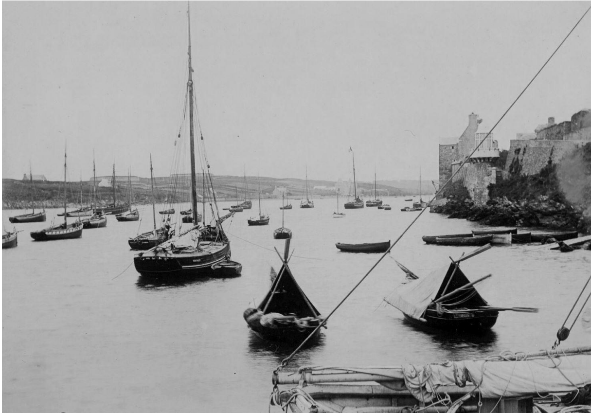
Deux bateaux kerhors, cabanés dans le port du Conquet, l'équipage cabane avec une toile spéciale dédiée à cet usage, on voit bien aussi les langoustiers du Conquet de différente tailles

L'univers maritime, si riche, de la rade de Brest ne fait pas parti du champ d'investigation de ce site, je vais toutefois vous parler de bateau Kerhors . L'espace maritime, de la rade de Brest, à fait l'objet de superbes études publié dans les tomes d'Ar Vag, La tradition des bateaux kerhors est superbement traité dans le tome 4. Mais Ouessant et l'archipel de Molène sont l'extrême ouest couvert par ce site.