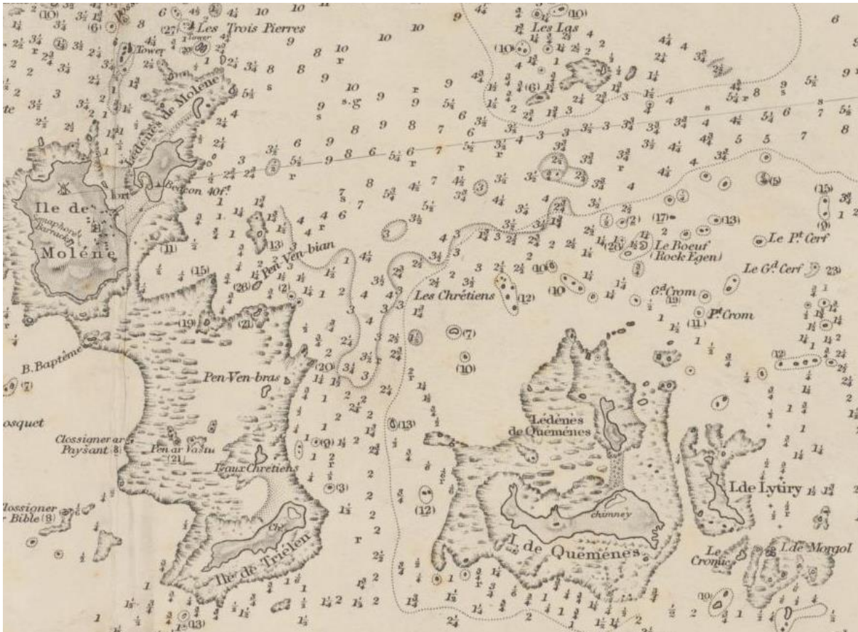
Une partie de l'archipel de Molène avec Lityry à l'est extrait de la carte du service hydrographique britannique de 1860