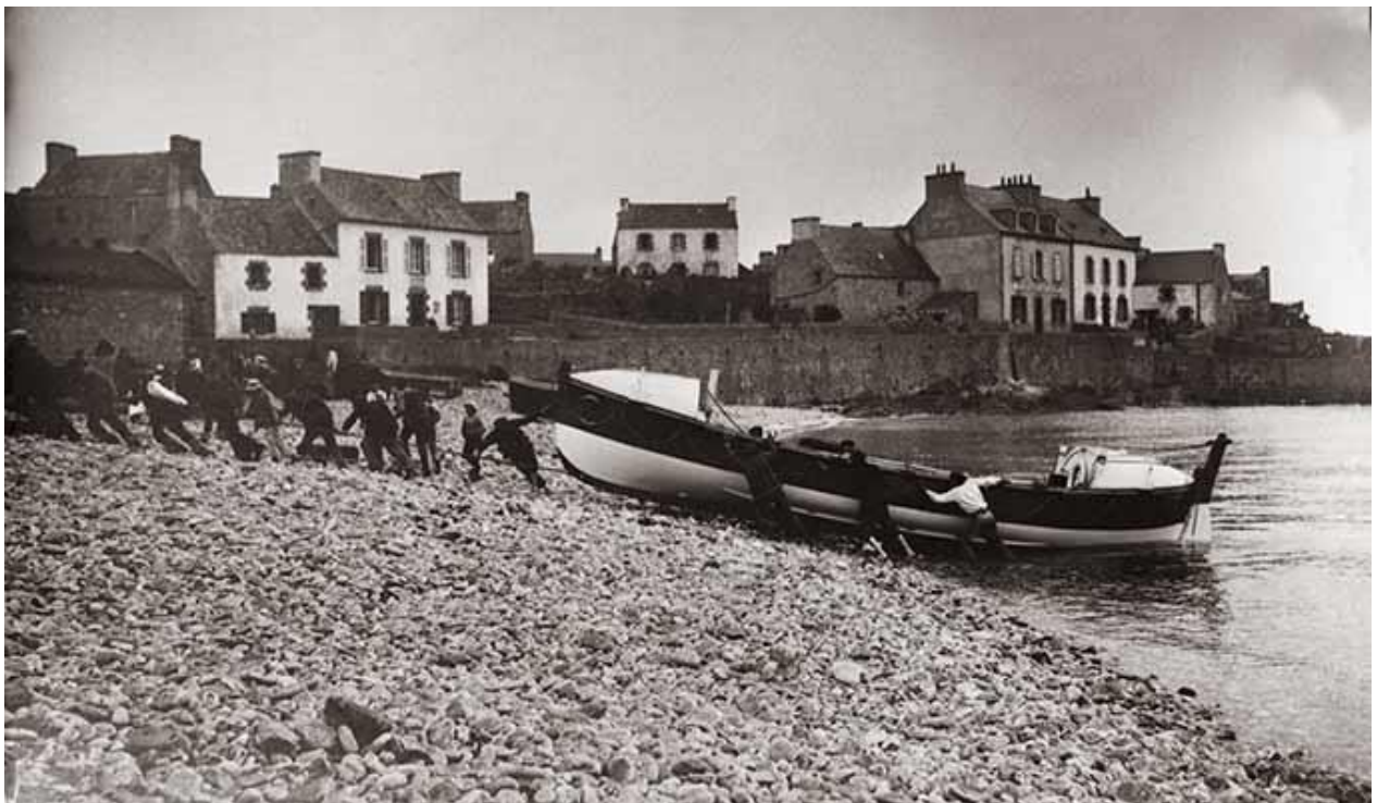
Canot de sauvetage Amiral Roussin remontant dans son abri dans le port de molène. Le canot construit en 1894 au havre au chantier Augustin Normand est du modèle 10.10m à redressement