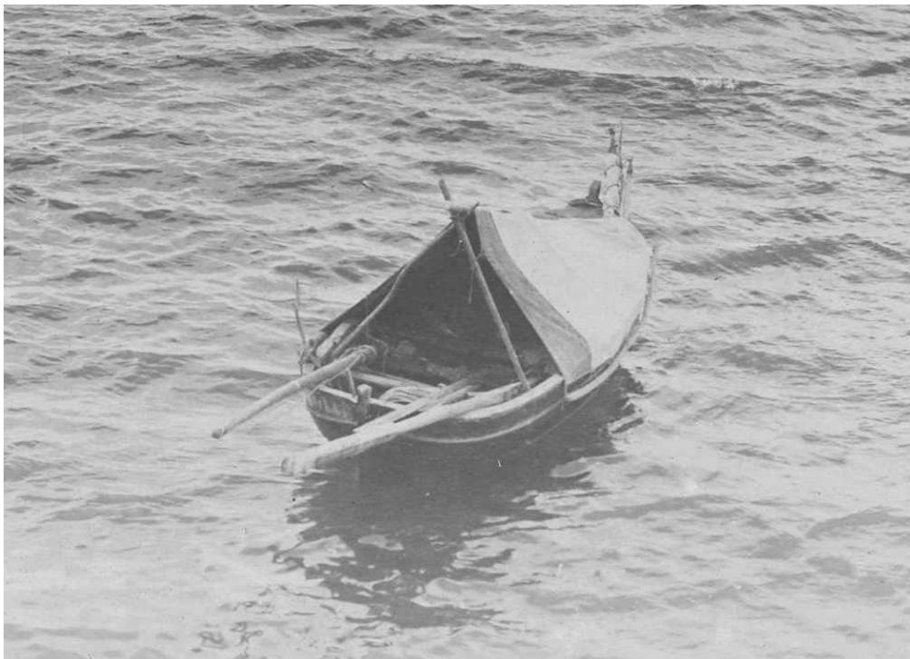
bateau kerhor au mouillage à proximité du château à Brest, celui-ci est plus fort de l'arrière

Mars 2016 Pierre-Yves Decosse http://www.histoiremaritimebretagenord.fr/