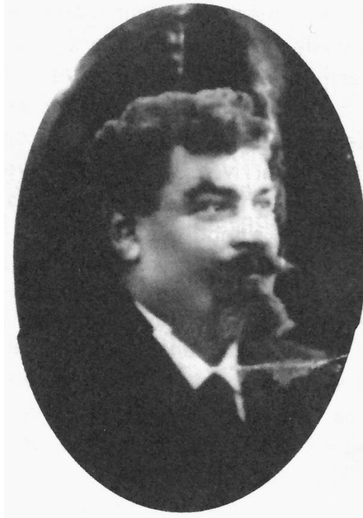
Le véritable visage du père Noël !

Le père Noël est né à l'île de Batz le 05 aout 1867 !