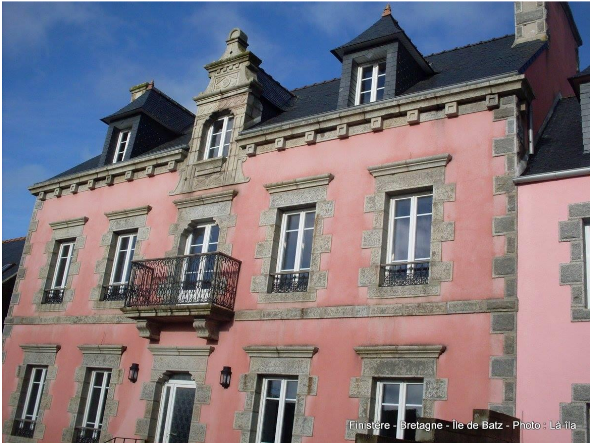
L'hôtel Ker Noël à l'île de Batz