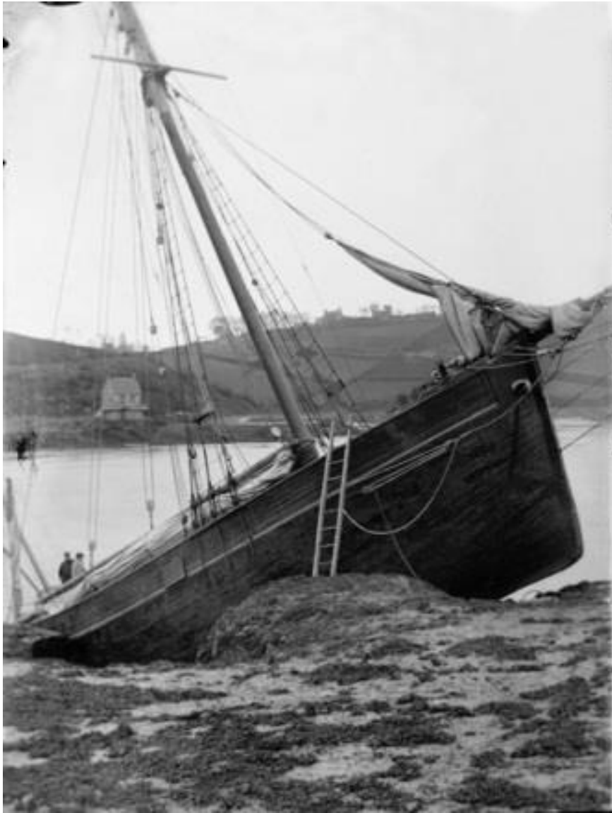
Cotre à tapecul de cabotage échoué en rivière de Tréguier, photographie de l'artiste et douanier Faudacq vers 1890

« Le sloop Protégé de Notre-Dame des Victoires, capitaine Ernot, partant du port de Tréguier avec un chargement de pommes de terre à destination de Portsmouth, le lundi 28 mars, a fait cote vis-à-vis le banc de Saint-laurent, sous le Questellic. c'est par suite d'une fausse rafale qui l'a surpris au moment où il virait de bord que ce navire c'est vu jeter à la côte.