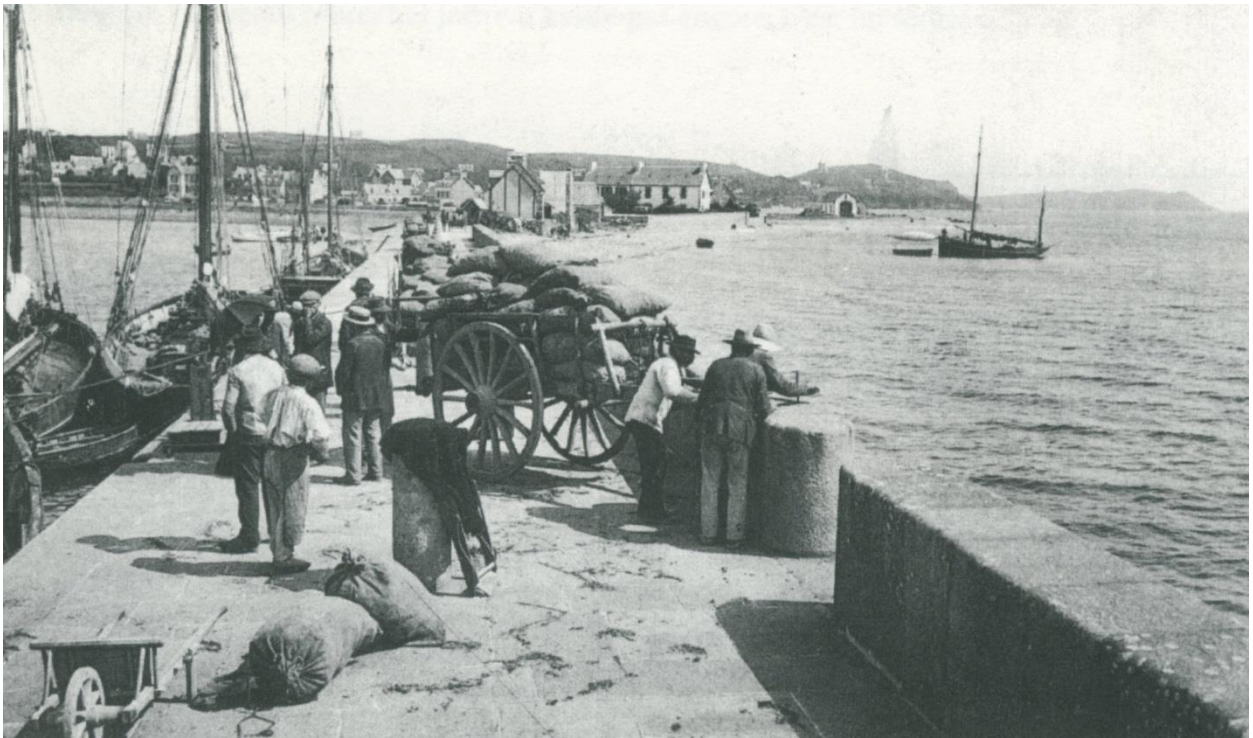
Le mole du linkin à Perros, chargement des pommes de terre, un petit sloup à tapecul de cabotage est au mouillage à l'extérieur du port